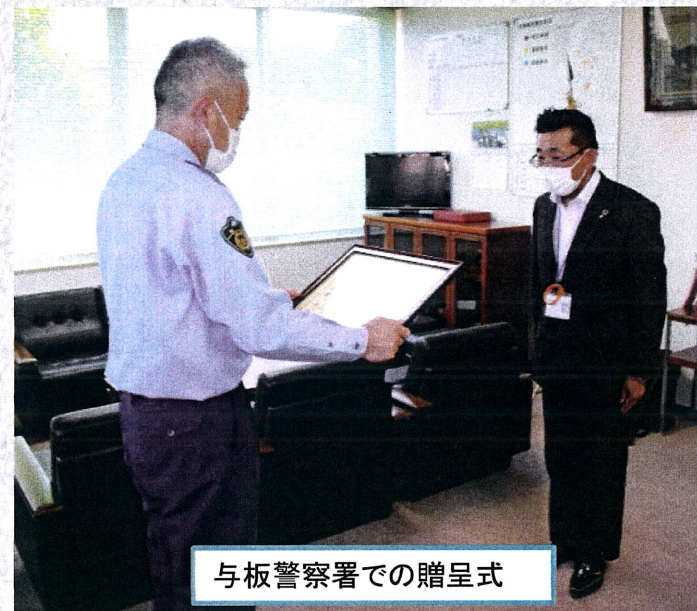
与板警察署での贈呈式