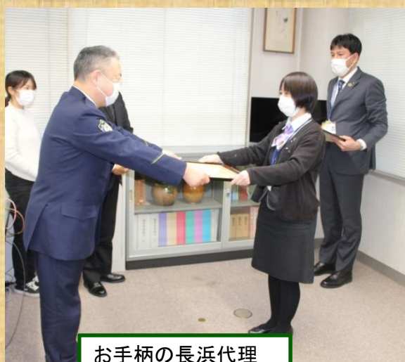
お手柄の長浜代理

当金庫は 特殊詐欺の撲滅 に取り組んでいます。 このような電話があったら 要注意 です!