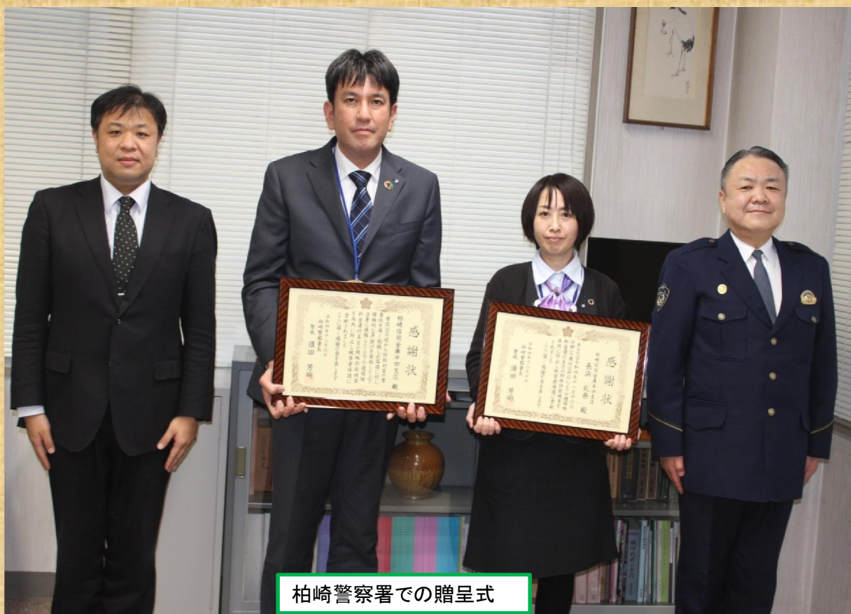
柏崎警察署での贈呈式

お客様の大切なご預金を守るため、日頃から防犯意識を高く持ち、これからも犯罪を発生させない店舗づくりを心掛けます。